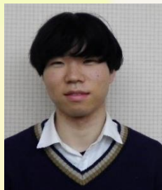
しえんいん せいの あきひろ 清野 寧冬